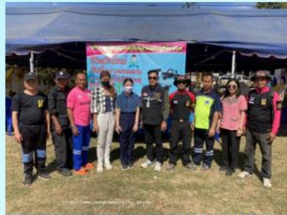
3-1-2566 ปลัดอำเภอเสด็จตรวจเยี่ยมจุดบริการ ประชาชนของเทศบาล.>>> อ่านต่อ