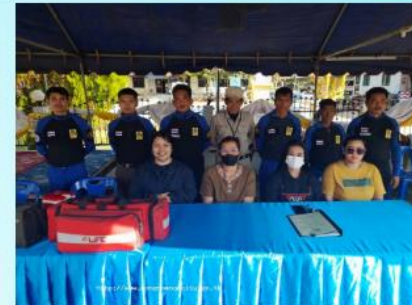
จุดบริการประชาชนของเทศบาลช่วงสงกรานต์ปีเก่า ต้อนรับปีใหม่ ปฏิบัติงานช่วง 29-12-2565 ถึง 3-1- 2566.>>> อ่านต่อ