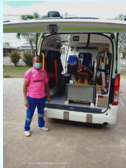
3-1-2566 เทศบาลโดย 1669 ให้บริการรับผู้ป่วย อาเจียนที่โรงพยาบาลส่งเสริมสุขภาพตำบลหนองน้ำใส ส่งรักษาต่อที่โรงพยาบาลเสด็จ.>>> อ่านต่อ