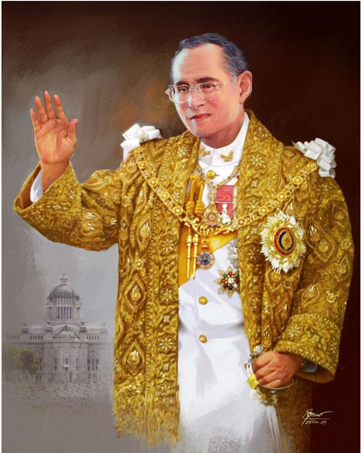
ปวงข้าพระพุทธเจ้า ขอน้อมเกล้าน้อมกระหม่อม สำนึกในพระมหากรุณาธิคุณหาที่สุดมิได้ เทศบาลตำบลหนองน้ำใส อ.สีคิ้ว จ.นครราชสีมา