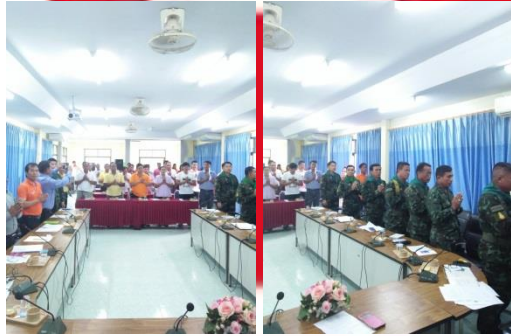
เสียงไร้สาย

กองพันพัฒนาที่ 2 จ.นม. เสียงไร้สายเทศบาลตำบลหนองน้ำใส